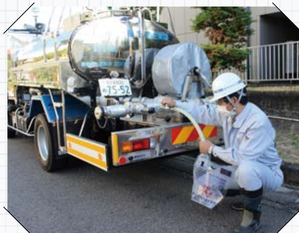
非常用飲料水袋に給水する様子